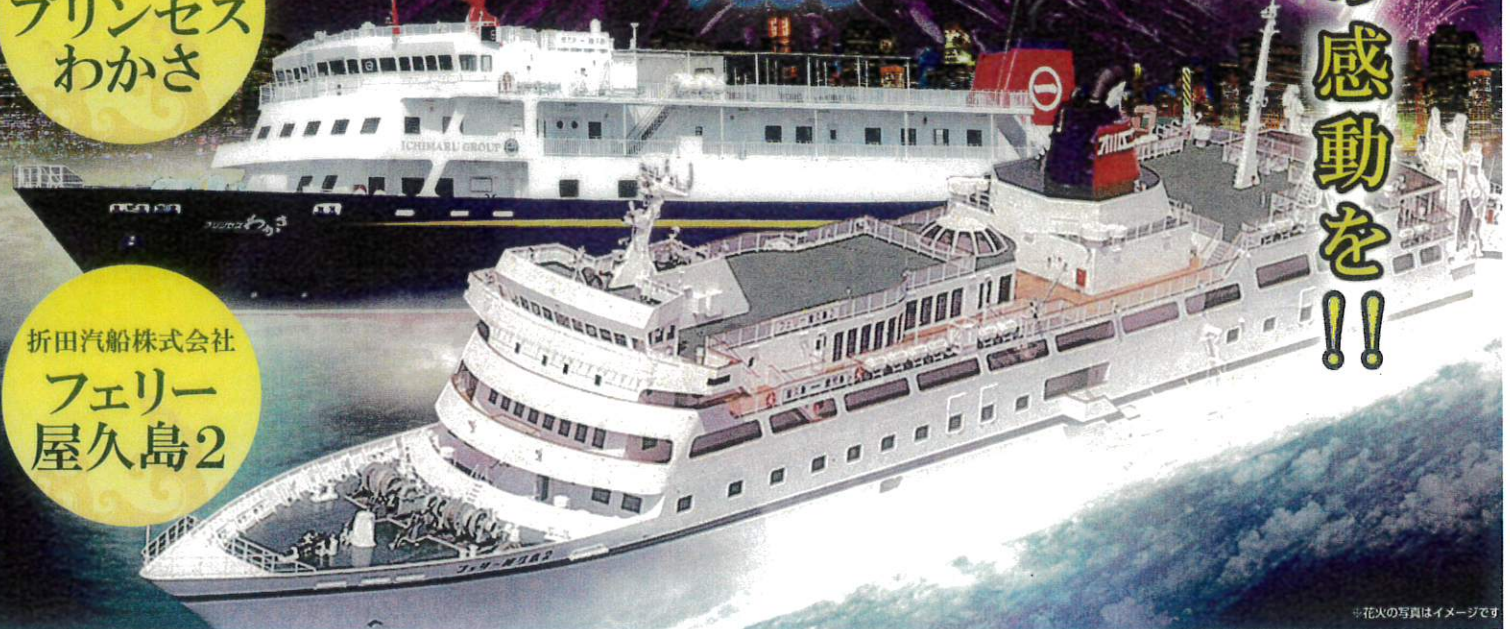
※花火の写真はイメージです